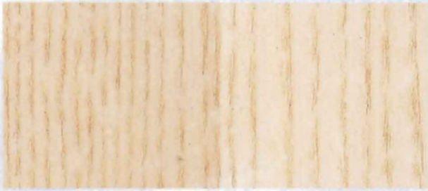
N - 800 WHITE