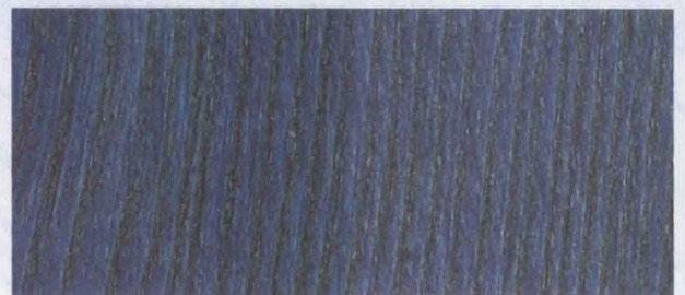
N - 013 BLUE