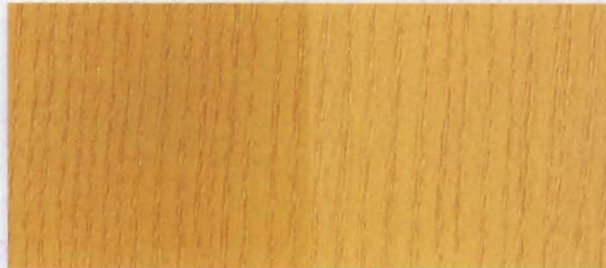
N - 021 NATURAL OAK