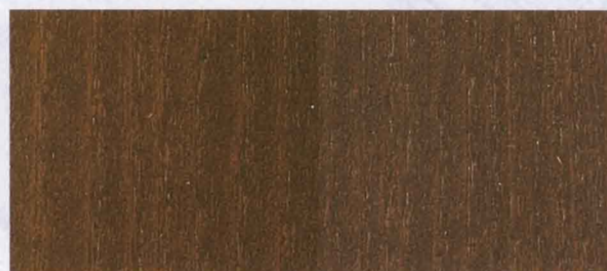
N - 019 DARK WALNUT