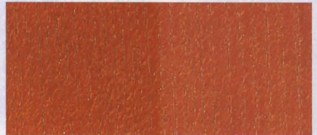
N - 028 CHERRY