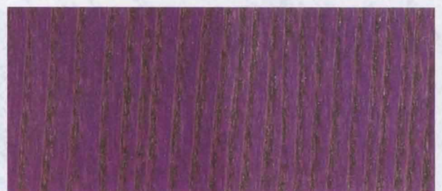
N - 025 VIOLET