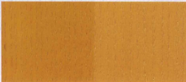
N - 022 LIGHT OAK