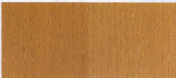
N - 023 MEDIUM OAK