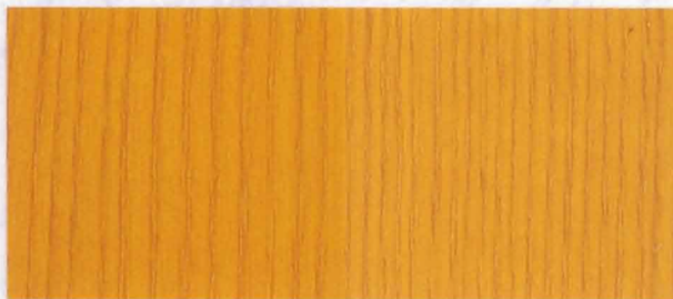
N - 026 YELLOW