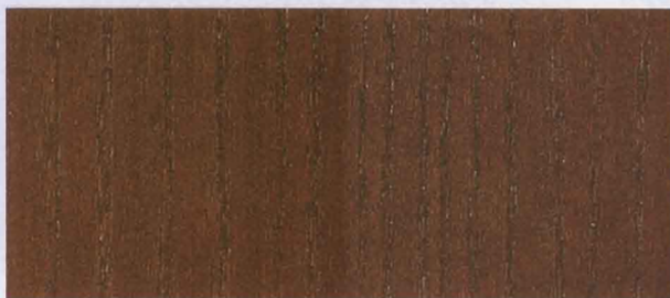
N - 018 WALNUT