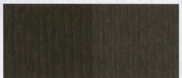
N - 020 BLACK

NATIONAL PAINTS TAKES NO RESPONSIBILITY FOR SLIGHT VARIATIONS IN COLOR