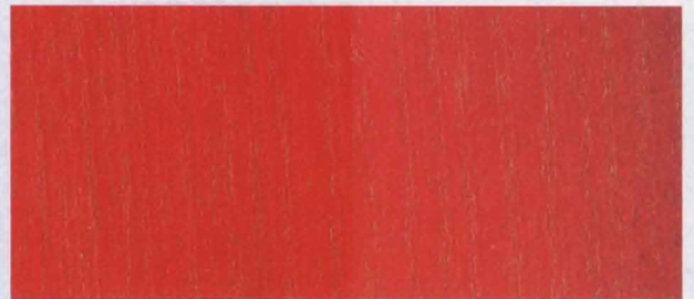
N - 015 RED