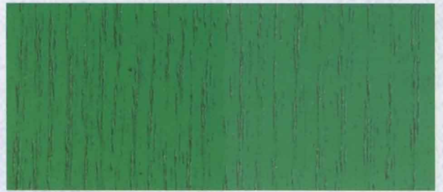
N - 014 GREEN