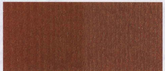
N - 030 LIGHT MAHOGHANY