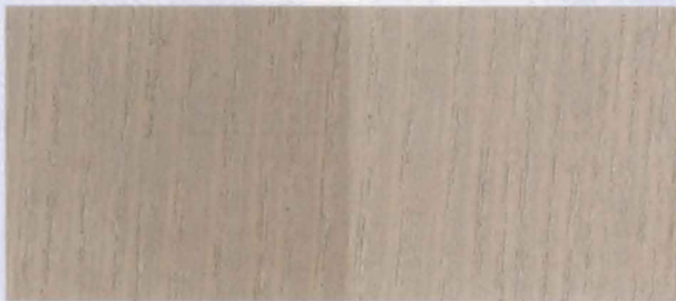
N - 011 SILVER