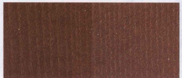
N - 031 DARK MAHOGHANY

SHADES ARE INDICATIVE ONLY. IT MAY VARY ON ACTUAL SURFACE