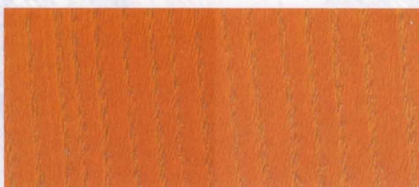
N - 024 PINE