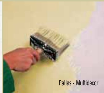
Pallas - Multidecor