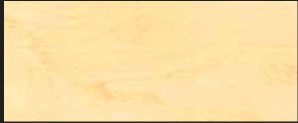
KREOS BIANCO WHITE