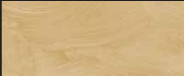
KREOS BIANCO WHITE