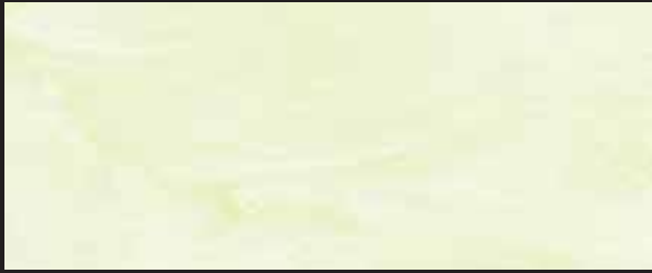
KREOS BIANCO WHITE