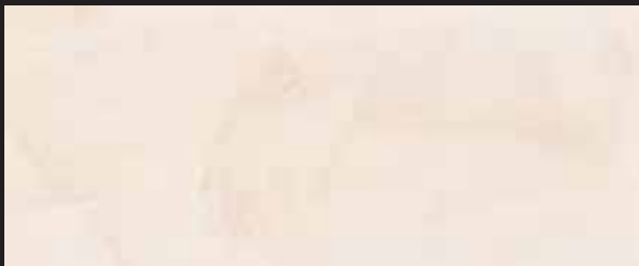
KREOS BIANCO WHITE