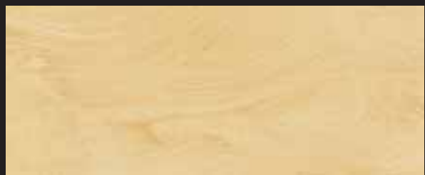
KREOS BIANCO WHITE