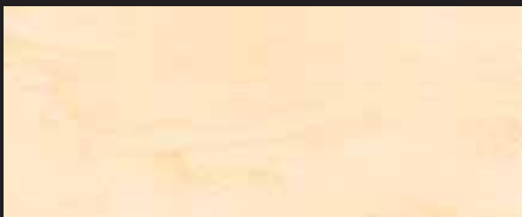
KREOS BIANCO WHITE