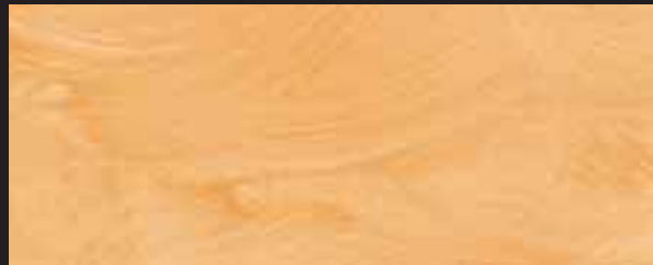
KREOS BIANCO WHITE