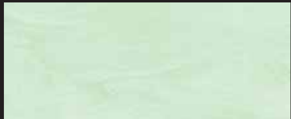
KREOS BIANCO WHITE