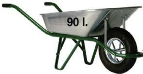
Standard Plus 4051