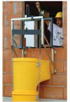
Treuil à main EAN 315503181040 5