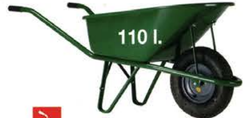
Renovation 1061 G