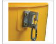
Fixation renforcée avec gachette de sécurité (exclusivité HAEMMERLIN)