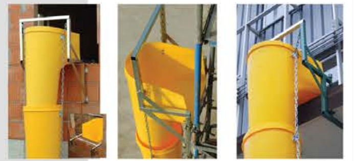
Support allège EAN 315503181030 6 Support échafaudage EAN 315503181045 0 Support pour dalles EAN 315503181035 1