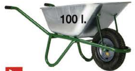
Renovation 108 G

The standard professional range has withstood the test of time and forms a valuable part of the Haemmerlin product portfolio. Its special characteristics are a double shifted edge around the tray for strength and rigidity which is further enhanced by front and side ribbing, and Ø 400 mm wheel with a 4 ply pneumatic tyre (not 2 ply like many competitors).