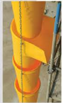
Trémie de chargement en situation intermédiaire